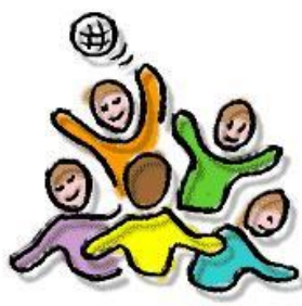
S P E L