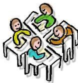
W E R K