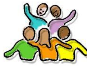
V I E R I N G